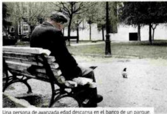
Una persona de avanzada edad descansa en el banco de un parque.

«Situaciones de desamparo de personas mayores que viven solas y apenas pueden cubrir sus necesidades básicas y que no cuentan con redes de apoyo familiar o social, así como el aislamiento o el abandono que a veces se producen, son realidades que en ocasiones permanecen ocultas y que es necesario identificar para desarrollar acciones preventivas y de apoyo para dichas personas», señalan.